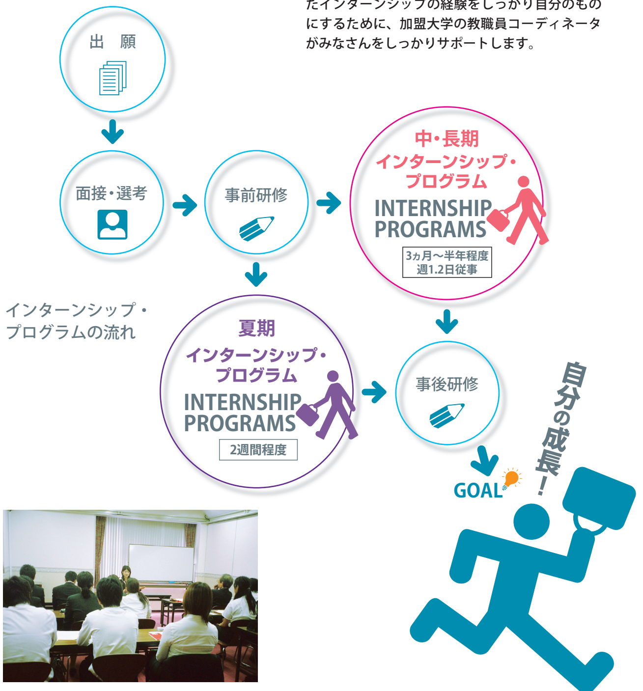
インターンシップ・プログラムの流れ