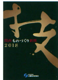
関西ものづくり新撰冊子

「中小企業のものづくり基盤技術の高度化に関する法律」による計画認定や「戦略的基盤技術高度化支援事業」の施策活用については、選定審査に当たり加点対象とします。