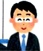
<事業効果イメージ図>