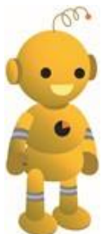
工業統計キャラクター・コウちゃん

詳しくは、【工業統計調査 実施事務局ホームページ】 https://www.kougyo-st.go.jp をご覧ください。