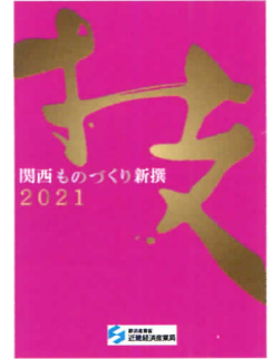
関西ものづくり新撰冊子 (イメージ)